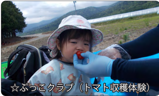
☆ぷっこクラブ（トマト収穫体験）

夏休みは家族でお出かけしたり、楽しい思い出もできたでしょうか。 子ども達の笑顔と元気な姿に、夏バテも吹き飛ばすくらい私達も元気に過ごしたいと思 います！