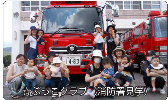
☆ぷっこクラブ（消防署見学）