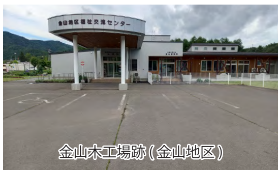
金山木工場跡(金山地区)