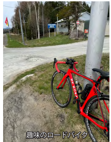
趣味のロードバイク

これからも、地域おこし協力隊として南富良野町の発展に貢献し、地域の皆様と一緒に町を盛り上げていきたいと思っています。どうぞよろしくお願いたします。