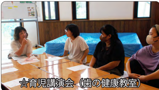
☆育児講演会（歯の健康教室）

歯科衛生士さんを招いて、子どもの歯についてみ んなでお話を聞いたり、お母さん達同士で歯磨き について情報交換しました。