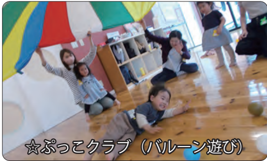
☆ぷっこクラブ (バルーン遊び)

太陽の日射しがどんどん強くなり、子どもたちの元気もパワーアップ！ 水遊びや花火など、夏しかできない遊びもたくさんあります。南富良野の夏をたくさん楽しみましょう。