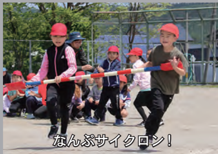
なんぶサイクロン！