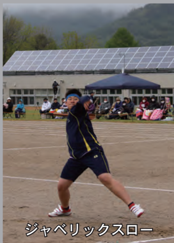
ジャベリックスロー