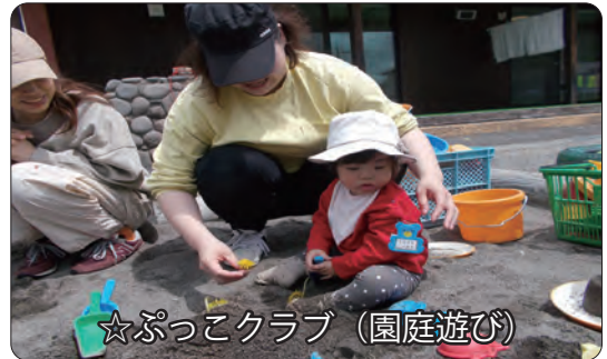
☆ぷっこクラブ (園庭遊び)

カラフルなバルーンの下を行ったり来たりもぐったり。ふわっと大風、気持ちよかったね！