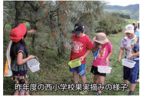
昨年度の西小学校果実摘みの様子

小果樹農園では、8種類の果樹が管理され、毎年、果実摘みを楽しむことができます。昨年度もハスカップやブルーベリー、ラズベリー、ぶどうなど色とりどりの果実が実り、保育所やぷっこクラブ、南富良野西小学校、各放課後子ども教室、地域サロンなどの団体から個人まで、多くの町民の皆さんが訪れ、高台の爽やかな風と十勝岳連峰の雄大な景色を楽しみながら果実摘みを行っていました。