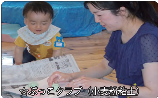
☆ぷっこクラブ (小麦粉粘土)