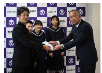
緑の募金受け渡し(17日)