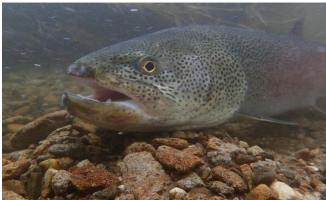
【国内最大級の淡水魚 イトウ】