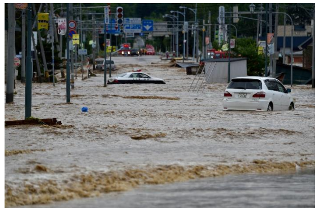
【平成28年災害当時の様子】