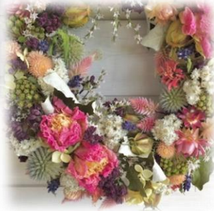
ドライフラワーリース 各20,000円

南富良野の高原に位置する工房農園で、農薬を使用せずドライフラワー用に栽培した花を自然乾燥させ、蔓の土台にアレンジしたナチュラルなリース(25cm径)です。たくさんの花を使った豪華なオリジナルリースなので、ギフトにも大変喜ばれています。イエロー・ピンク・ブルーからお選びいただけます。