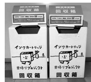
設置されている回収箱

里帰りプロジェクトについての詳細はこちら http://cweb.canon.jp/ecology/satogaeri/index.html